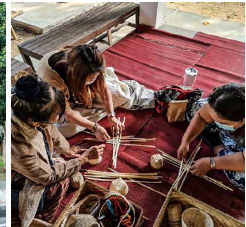
치앙마이 공예 축제 중 공예 워크샵