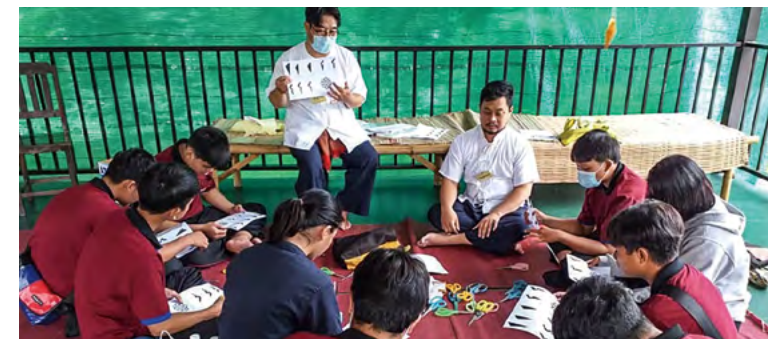
전통적인 종이 절단 워크숍