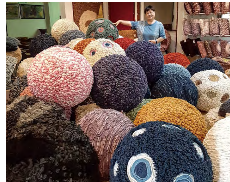
그린 홈 제품의 부아 밧 아트

치앙마이의 공예품 및 민속 예술 제작은 튼튼한 줄기와 넓은 가지들을 가진