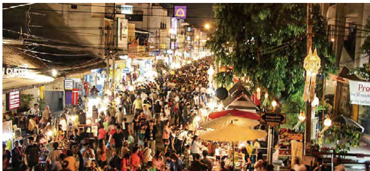
치앙마이시의 길거리 풍경

출처: http://www.cmcity.go.th/News/8198-1๕๖๖๓.html