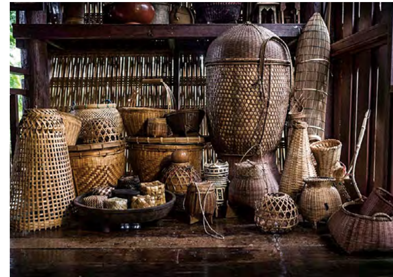
일상생활에서 이용하는 전통적인 대나무로 짠 제품들