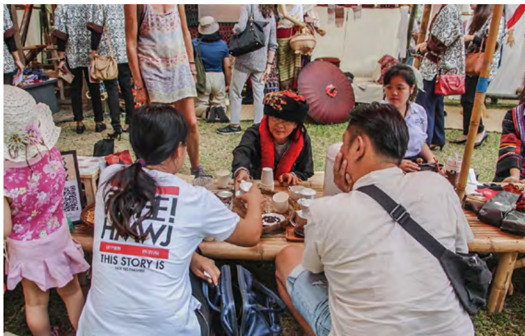
치앙마이 공예 축제 중 문화 전파 활동

태국 북부에 사는 사람들을 통칭하는 라나족은 원래 일상 용품으로 공예제품을 만들었다. 이후에 주변지역에서의 주문이 많아지기 시작하자, 이들은 좀 더 상업적인 목적으로 공예품을 만들기 시작했다. 이 지방 공예품들 또한 다른 지역 사회와의 교류를 위한 공물로 사용되기도 했다. 라나족이 그들의 공예품을 판매하던 장소들은 단순히 물건을 교환하는 자리였을 뿐만 아니라 남녀노소, 사회적 지위 등을 불문하고 자유롭게 정보와 지식, 기술을 공유할 수 있는