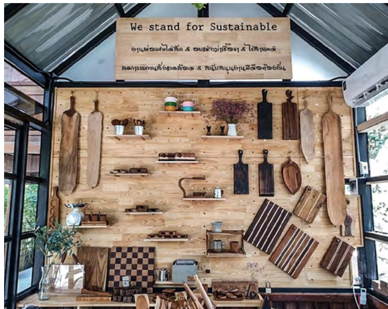
치앙마이의 창의적인 공예품들

문화적 뿌리로부터 현대의 사회적 맥락에 이르기까지 공예는 다양한 측면에서 창의성과 지속가능성으로 계속해서 개선될 수 있다. 공예 커뮤니티의 지속 가능한 발전은 창의적인 공예와 민속 예술 발전에 영향을 미칠 것이다. 이것은 나아가 지역 사회내에서 주민들의 안녕과 양질의 교육, 그리고 좋은 일자리 창출을 장려할 것이다. 또한, 이것은 지속 가능한 지역사회 기반 관광으로 이어질 것이고 지역 경제의 지위를 높여줄 것이다.