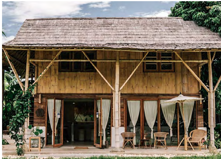
전통적인 소재와 디자인으로 지어진 커피숍