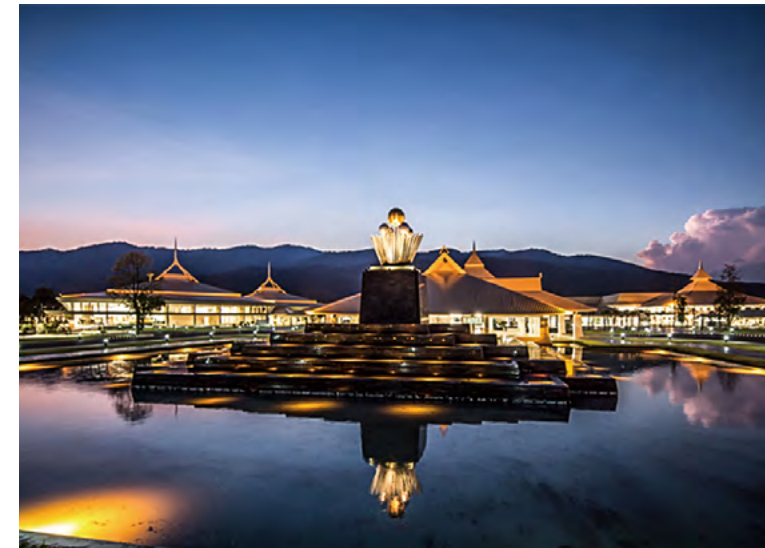
현대적 스타일과 융합된 라나지방의 건축 양식