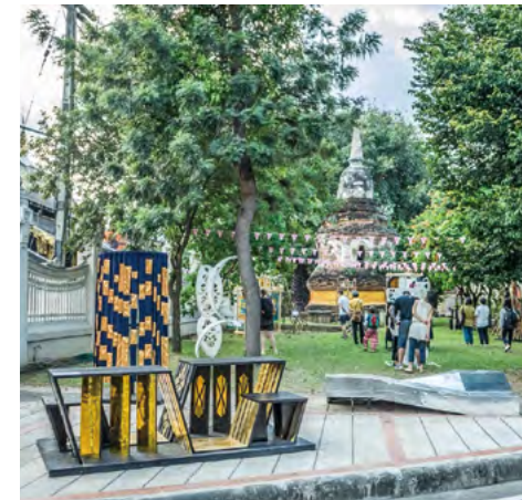
구 시가지내의 예술 작품 설치