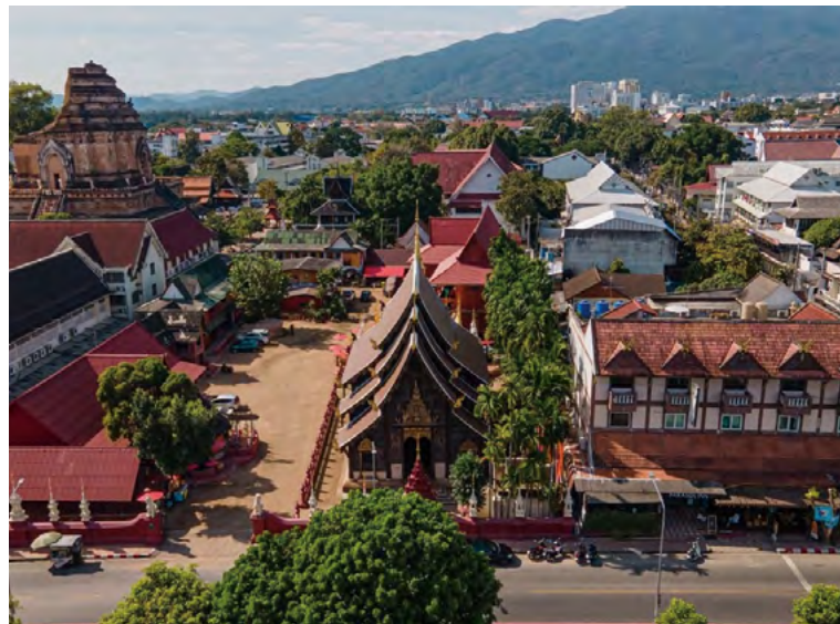
치앙마이시의 구 시가지 풍경

ตอนยอนเมืองเจียงใหม่-ริมตอกไม้งาม-chiang-mai-blooms