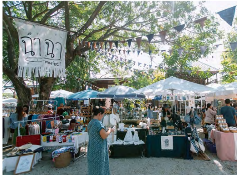
“참 차 시장”, 산감풍 구의 지역 공예 시장