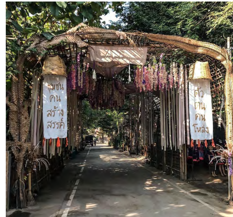
“로앙 힘 카오”, 산감풍 구의 지역 공예 공동체

치앙마이에는 여러 전통 공예 생산지가 있으며, 그곳들에서 나오는 공예품들은 크게 조각, 직물, 나무 조각, 전통 건축, 그림, 바구니, 종이, 금속, 칠기 등 9가지로 나눌 수 있다. 치앙마이는 문화적 다양성으로 널리 알려져 있는데, 많은 토속 지식과 전통문화가 지속적으로 보존되고 지원되어 지역주민들을 위한 최대한의 이익을 추구해 왔다. 이러한 특성은 도시 내의 경제적 상화들과 사회 보장에도 큰 영향을 끼친다. 문화산업은 도시의 중요한 수입원 중 하나로서 장려되고 있으며 지원을 받아 왔다. 지역 상품개발과 문화자본에 대한 투자는 많은 일자리 기회 창출로 이어졌으며, 문화산업과 관광산업을 통한 소득분배로도 이어졌다.