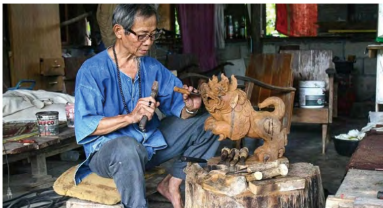
반 타와이 마을의 목각

하지만 반 타와이 마을의 양적 생산은 큰 문제를 직면했는데, 이는 장인들이 고객의 취향과 요구에 맞춘 주문 제작 작업을 주로 하는 경향 때문이었다. 이 결과, 카우보이, 미키마우스, 아파치 등 유명하면서도 일반적인 캐릭터들이 반복적으로 제작되었다. 또한 이런 제품들에는 가격이 저렴하고 품질이 떨어지는 자재가 주로 활용됐다. 이러한 제품들은 당연하게도 장인들이 이전에 지녔던 전문성이나 문화적 정체성을 반영할 수 없었다. 결국, 소비자들은 목각의 진정한 가치를 제대로 깨닫지 못하게 되었다. 이런 상황속에서도, 장인들은 여전히 전통적인 공예품을 만드는 데 익숙했고, 또 그 과정에 더 편안함을 느꼈다.