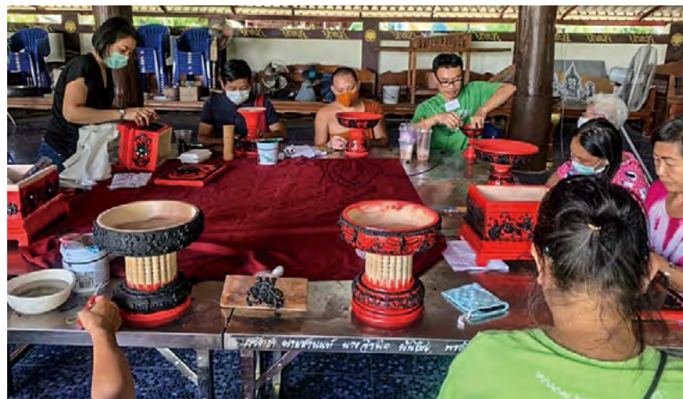
반 타와이 마을의 락 사목 조각 워크숍