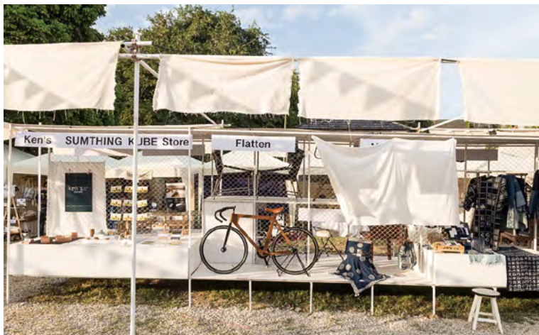
치앙마이 디자인 주간에 전시된 창의적인 제품의 디자인

생산의 효율성을 높이기 위해, 제품의 생산 과정은 보통 여러 활동으로 나뉘어 지고, 각각의 개인들에게 다른 임무가 부과된다. 이 "노동의 분업"이 끝나면, 모든 부품들은 생산기지에서 하나의 제품으로 조립된다. 이러한 방법의 생산 공정은 제품 생산에 있어 그들만의 지식이나 전반적인 기술을 가지고 있을지도 모르는 노동자들을 탈숙련화 시키는데 일조를 할 수 있다. 그러나, 이와 동시에 노동자들로 하여금 본인이 맡은 특정한 업무에 대한 잠재력과 전문성을 강화하는데