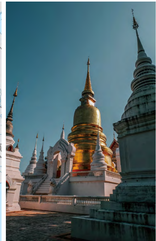
수안 독 절에 있는 탑