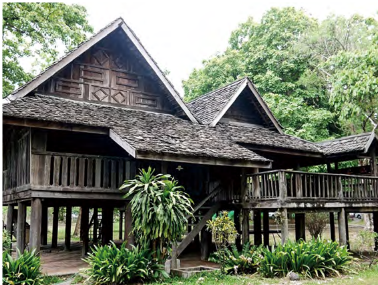
라나 지방 전통적인 양식의 집

이처럼, 반 타와이 마을의 목각 양식은 각각 다르지만, 모든 양식은 개별 고객의 취향에 맞게 제작되고 있으며, 이는 태국 수코타이 주나 다른 나라에서 볼 수 있는 목각업 상황과 유사하다 (Wattanaphan et al. 2001, 47-50).