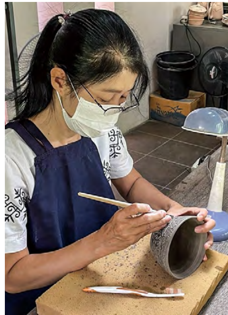
시암 청자 공장

이 공장의 대표 아이템은 보기 좋은 꼬임의 꽃 무늬가 있는 등근 접시나 꽃병이다. 다양한 깊이와 크기의 컷으로 입체감을 살린 작품들은 장인의 기술을 매우 잘 보여준다. 이것은 중국 황제들의 전용 생활용품이었던 반면 일반인들은 사용할 수 없었던 청자 고유의 특징이기도 하다. 물론 요즘에는 누구나 청자 한 점을 소유할 수 있고, 또 청자로 만들어진 식기 세트 등 말 그대로 수백 개의 작품들을 살 수 있다. 하지만 불량 품질의 모조품 또한 많다는 것을 유의해야 한다.