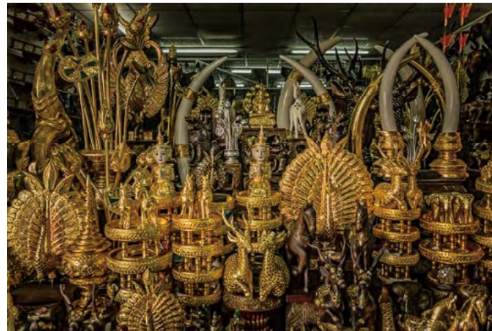
반 타와이 마을의 기념품 가게

기술과 장비등을 동원하는 개발도상국 내의 자본주의 생산은 기본적으로 투자자들이 소유하고 또 운영한다. 지역사회에서는 이처럼 고효율적이고 체계적인 생산을 할 수 없기 때문에, 자체적으로 생산을 하고자 한다면 자원의 비효율적인 사용과 더 많은 낭비를 초래하는 경우가 많다. 반면, 대량생산 시스템은 환경파괴, 대기 오염, 노동자들의 건강 문제등의 원인이 된다. 또한 대량 생산은 토착 지식이나 장인 기술에 따라 제작되는 전통적인 공예품들을 평가절하한다 (Wattanaphan et al. 2001, 39-40).