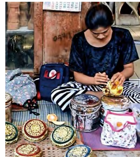
락 사목 조각기법