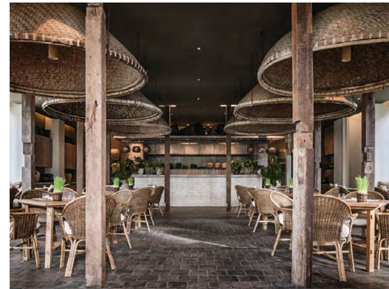
현대 인테리어 디자인에서 활용되는 전통 공예품들