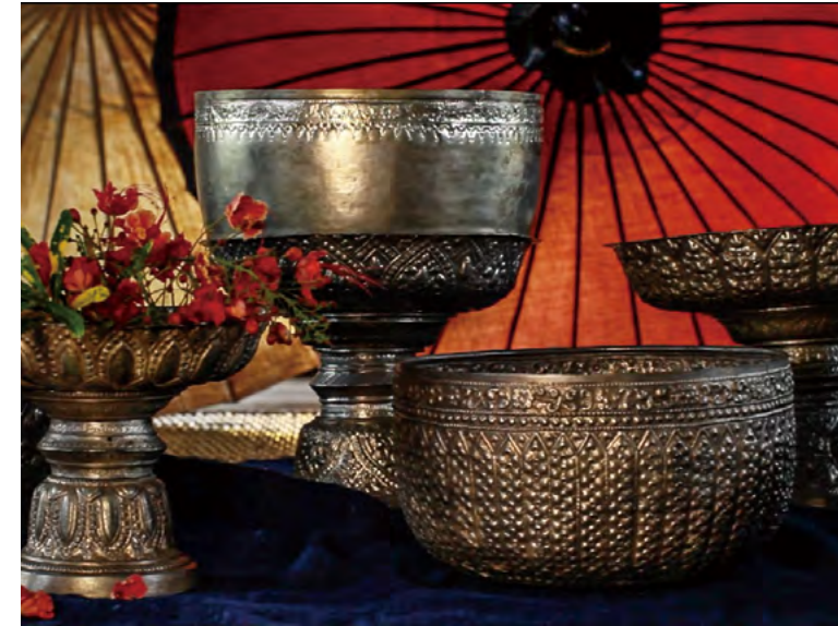
전통적인 은그릇들

그럼에도 불구하고, 위에서 언급한 공예품들은 시간이 지남에 따라 진화해왔고, 이는 자연스럽게 도시의 공예품 생산 공정에도 영향을 끼쳤다. 예를 들어 제품들을 위한 원자재들이 부족하게 되었고, 새로운 기술들과 적응력이 요구되었으며, 기술을 승계할 수 있는 인력 확보에도 문제가 생기게 되었다. 더욱이, 기존의 공예 제품들은 더 이상 현대사회에서 인기가 없었다. 따라서 대부분의 공예업자들이 인기 있는 몇가지의 제품들을 모방하는 경우가 많아졌고, 이는 가격이 싸고 품질이 불안정한 공예 제품들의 만성적인 공급 과잉 현상으로 이어졌다. 그나마 성공한 업자들도 더 이상 신제품을 디자인하거나 개발할 의지나 동기가 부족했다. 그 결과, 여러 공동체에서 볼 수 있는 공예품들은 각각의 특색이 없고 거의 다르지 않았다. 또한 공공단체와 민간단체가 함께 시작한 지역공예 보전과 관련된 많은 사업들도 의도치 않게 공예품에 변화를 주며 지역공예의 가치와