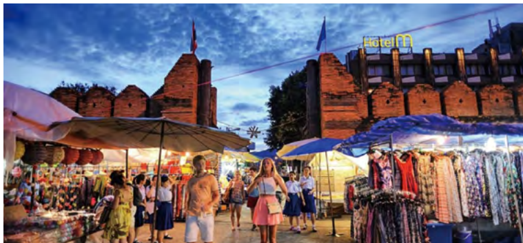
치앙마이시의 길거리 풍경

예술과 문화의 도시로서 유명한 치앙마이는 태국 북부에 위치해 있으며, 란나 왕국의 중심지였다. 이 도시는 천연 자원이 풍부하고, 삶의 방식, 지역 전통, 종교, 그리고 중요한 사적들 등의 문화 유산이 풍부하다. 이러한 유산들은 지난 725년 동안 도시의 진화와 더불어 여러 세대를 통해 전해져 왔다. 이 중 공예 공동체는 치앙마이시의 중요한 정체성을 이루는 중요한 문화 유산이다. 치앙마이에서 발견되는 문화유산은 크게 두 가지로 분류할 수 있다: (1) 유형문화 유산인 공예,