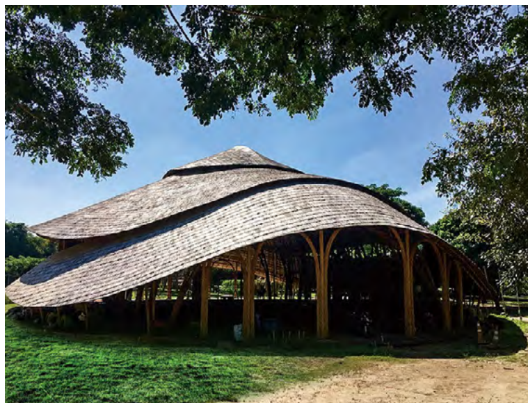
현대적 스타일과 융합된 라나지방의 건축 양식