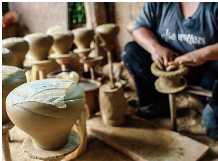
무앙 쿡 도자기 마을의 도자기 제작