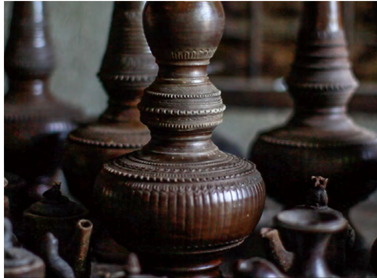
메이 왕 구의 도자기