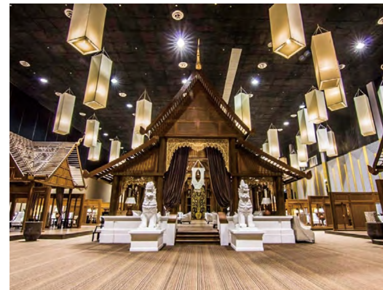
치앙마이 국제 전시 컨벤션 센터 내의 라나 지방 건축 모조품