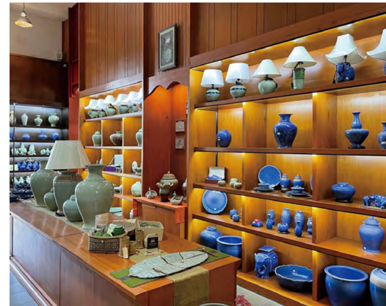
시암 청자 공장

물에 먼저 세척한 다음 필터로 눌러 물을 빼냅니다. 펌프들과 분쇄기를 거친 후에, 이 혼합물은 이제 부드러운 판 덩어리가 되어 모양을 잡을 준비가 되어 있습니다. 이 점토는 원하는 모양과 목적에 맞게 변형 시키기 데에는 세 가지의 선택이 있습니다: (1) 특별한 형상을 만들기 위한 석고 주조, (2) 접시나 평평한 물체를 만들기 위한 물레성형, (3) 꽃병이나 냄비를 만들기 위해 돌리거나 던지는 방법. 약 800°C에서 첫 번째로 굽는 “비스킷” 이라고 불리는 과정은 8시간 정도가 걸리는데, 이를 통해 갈색 테라코타가 만들어집니다. 이것을 유약에 담그거나 칠을 한 후에 다시 가마로 넣어 약 1,200°C에서 다시 8시간 동안 굽습니다. 이 후 가마에서 나올때, 이 점토는 아름다운 예술 작품인 청자로 변합니다.