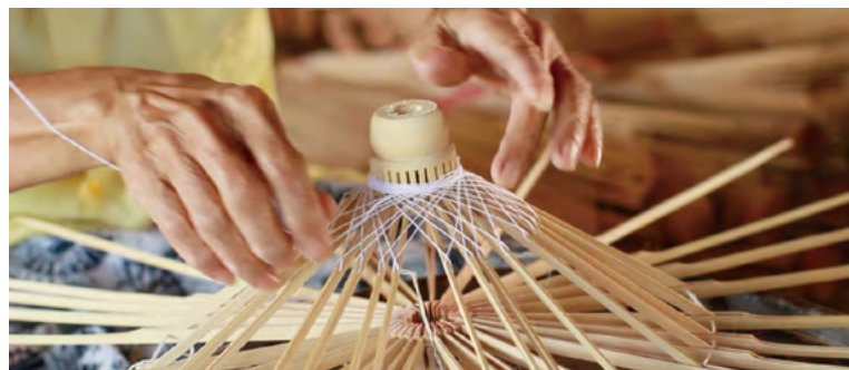
우산 제작 과정