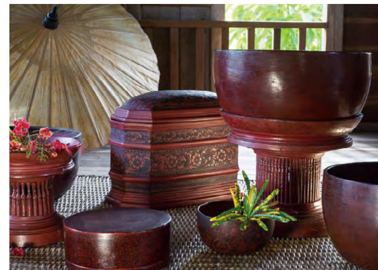
타이 쿠엔 민족 (치앙마이의 여러 민족들 중 하나)이 사용하는 전통적인 칠기