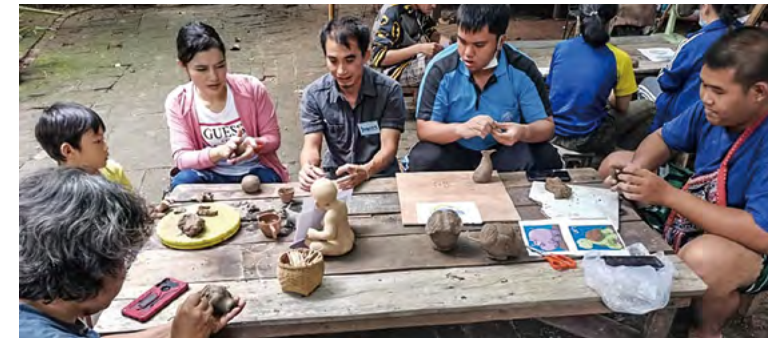
메이 왕 구 도예학습관에서 도예 워크숍