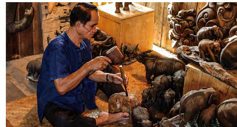
반 타와이 마을의 목각