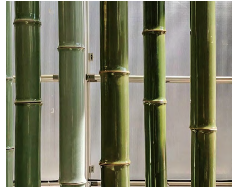
2019 치앙마이 디자인 주간에 전시된 대나무 벽

유약을 녹이는 과정에서 목재의 재가 중요한 원료이기 때문에 모든 조각을 같은 음영으로 표현해 낼 수는 없다. 이 재들은 각각 다른 종류의 나무에서 나오기 때문이다. 나무가 같은 종이라 할지라도 그 나이와 지역이 다를 수 있다. 이 차이로 인해 청자들은 각각 독특한 색감과 특별한 성격을 지닌다. 분명 현대 기술은