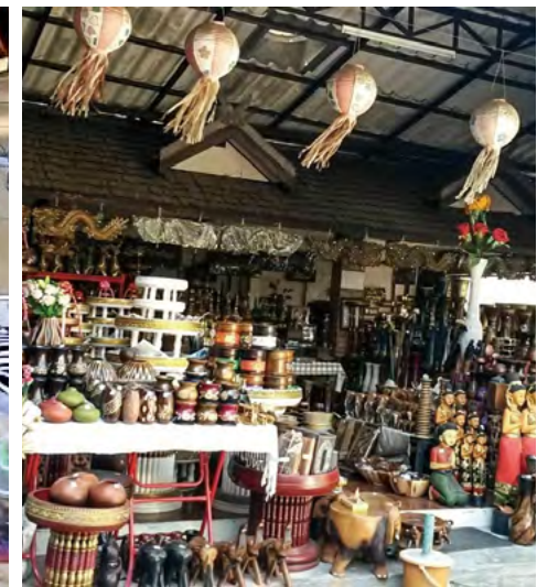
반 타와이 마을의 기념품 가게