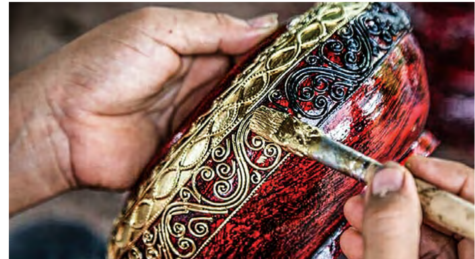
락 사목 조각기법 (락 사목은 사목, 흑칠, 나무, 기름, 석회를 강황으로 중화시킨 재료이다)