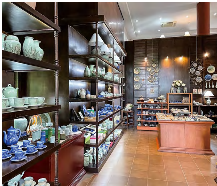
시암 청자 공장

"논두렁의 검은 점토"는 이것만의 특별한 특성 때문에 사용됩니다. 이 점토를